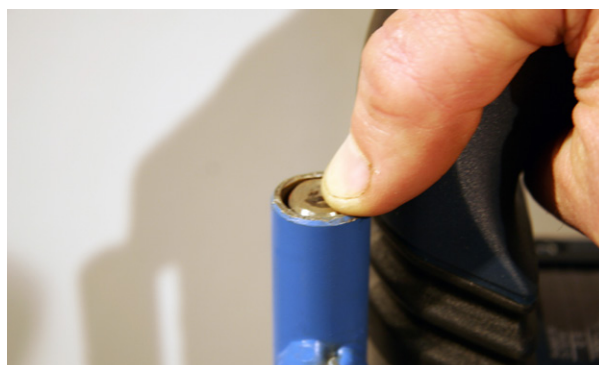
Monteringsbild 4. Justera in parallellstaget så att parallellstaget är i nivå med signalrörets överkant när slagstiftet är nere i sitt nedersta läge genom att flytta klämringens läge på maskinens hals (spåret för det främre handtaget) och skruva fast klämringen. Räcker inte detta finns det justeringsmöjligheter på den gängade stängen som håller fast den slitsade hylsan lossa då båda muttrarna och skruva upp/ner den övre muttern och lås fast parallellstaget med den undre muttern.