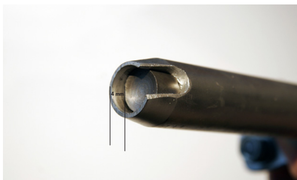
Monteringsbild 3. Kontrollera att det är 4 mm mellan spetsen och slagstiftets högsta punkt när slagstiftet är i sitt nedersta läge. Om avståndet är mindre så lägg emellan fler brickor tills avståndet på 4 mm har uppnåtts. Om det är större än 4 mm tas brickor bort tills 4 mm uppnåtts. Justeringen är enkel att utföra genom att den nedersta muttern lossas på det fjäderbelastade parallellstaget och den slitsade hylsan tas bort, därefter tas den nedre gummiringen och distansröret på slagstiftet bort och brickorna läggs till / tas bort. Sätt tillbaka distansröret och gummiringen och skruva till sist tillbaka muttern som håller den slitsade hylsan på plats.