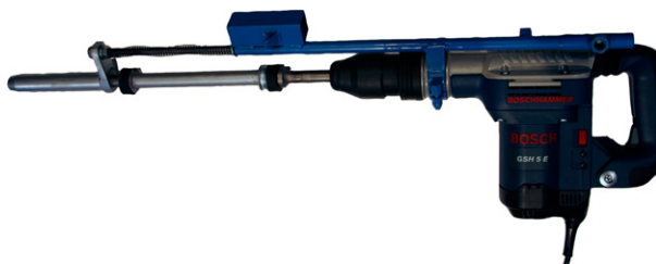
Monteringsbild 5. Nu är det klart att börja spika fast dina spikade kantstöd.